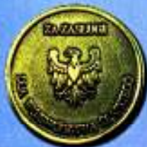
Złota Odznaka „Za Zasługi dla Województwa Śląskiego”