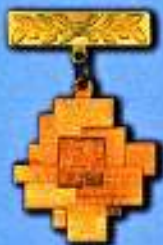
Złota Honorowa Odznaka „Zasłużony dla Budownictwa”