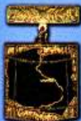
Złota Odznaka „Zasłużony dla Gospodarki Komunalnej i Przemysłowej”